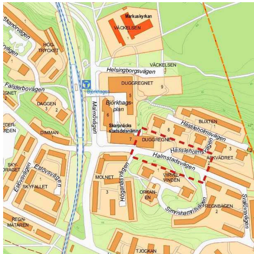
Ungefärligt planområde markerat.